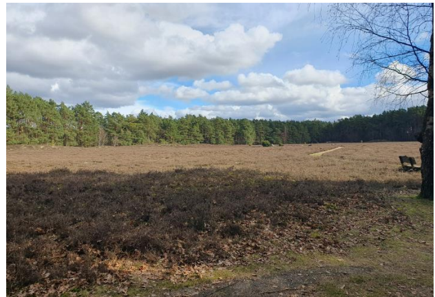
Geschafft, alle Jungkiefern entfernt