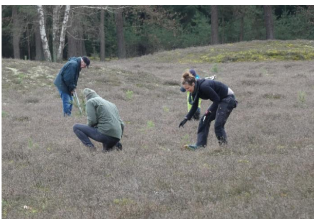
...große und kleine Helferinnen und Helfer