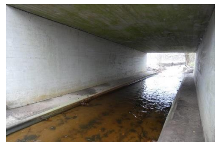
Brücke mit Bermen