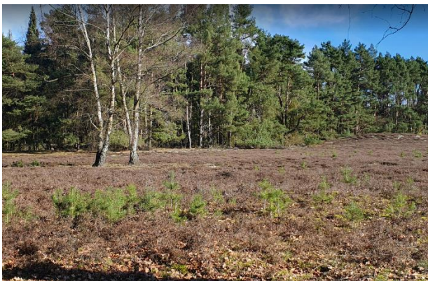
Vor der Maßnahme mit aufkommenden Kiefern

Die Ökologische Station bedankt sich bei allen großen und kleinen Helfenden für das Mit-Anpacken.