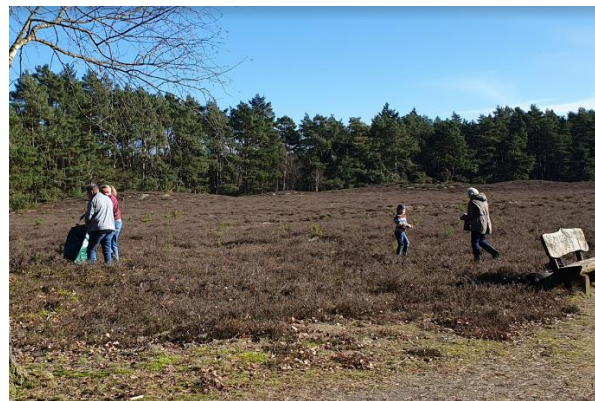
Entkusselung durch Ehrenamtliche...