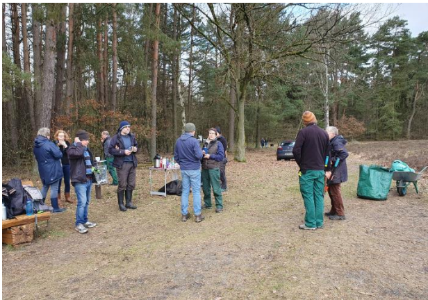
Austausch und Netzwerken