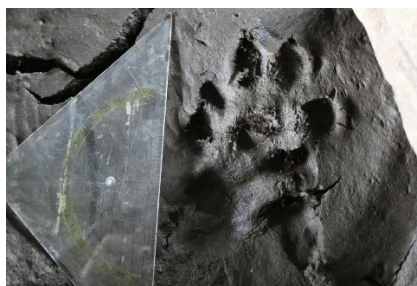
Trittsiegel des Fischotters