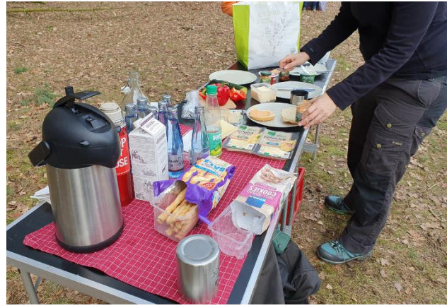
Stärkung nach getaner Arbeit